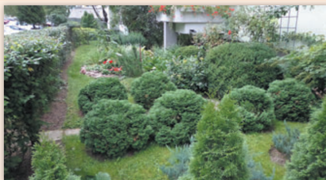
Nagrodzony ogródek przy ulicy Łukowej 7