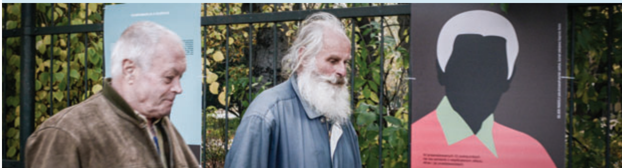
FOTO: GALERIA NA OGRODZENIU PARKU DRESZERA, SŁUŻEWSKI DOM KULTURY, WARSZAWA

Nowy Rok to nowe pomysły i projekty. Jednym z nich jest wydanie monografii Służewa. Chcemy, aby część wydawnictwa stanowił leksykon ludzi Służewa. Chcemy, aby znalazło się w nim miejsce dla wszystkich, którzy zdaniem Służewiaków tworzyli i tworzą przestrzeń, w której dziś żyjemy. Dlatego zwracamy się z prośbą o pomoc do każdego, komu sprawy Służewa są bliskie. Do końca kwietnia będziemy zbierać propozycje nazwisk ludzi, którzy powinni w leksykonie się znaleźć. Prosimy o propozycje postaci historycznych, ludzi znanych, którzy w jakikolwiek byli ze Służewem związani, ale też tych „zwykłych”, którzy zapisali się w jakiś sposób w historii naszego osiedla albo nadal tę historię tworzą. Może to nauczyciel, który wychował pokolenia Służewiaków, sąsiadka z bloku, która od zawsze dokarmiła bezdomne koty na osiedlu, bloger, który o Służewie pisze... Nie stawiamy żadnych ograniczeń – punktem odniesienia jest tylko Służew.