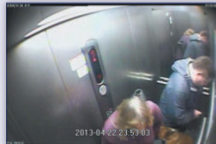
Pogryziona mieszkanka przez psa

stopniu przestępczości w porównaniu do innych osiedli i rejonów Dzielnicy Mokotów.