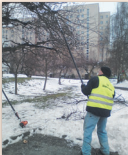
Usuwanie 'wilków' i chorych konarów przy Noskowskiego 20 – luty 2013

W przypadku młodych drzew wykonuje się cięcia formujące. Nie są to zabiegi wykonywane często ale konieczne. Cięcia mają na celu utrzymanie drzewa symetrycznego, bez deformacji pnia i aby ograniczyć ryzyko wyłamania konarów i rozdarć pnia w przyszłości. Przede wszystkim usuwamy gałęzie wyrastające pod zbyt ostrym kątem (to właśnie w miejscach ostrych rozwidlenia dochodzi do wyłamania konarów, co przy rozległej ranie może doprowadzić do obumarcia całego drzewa), oprócz tego należy usuwać gałęzie, które rosną zbyt silnie a ich obwód jest bliski obwodowi pnia. Jeśli taka gałąź jest bardzo rozrośnięta można usunąć ją częściowo aby tylko osłabić jej wzrost a nie całe drzewo. W następnym roku można usunąć resztę takiej gałęzi pomocniczej. Tak silnie rosnące gałęzie boczne 'ciągną' drzewo w bok wykrzywając cały pień. Należy również usuwać gałęzie rosnące w głąb korony, krzyżujące się i ocierające się ze sobą. Cięcia takie można wykonywać przez cały rok, jednak najlepsza pora jest pod koniec zimy, kiedy drzewa jeszcze nie rozpoczęły wegetacji a już nie grożą im bardzo duże mrozy.