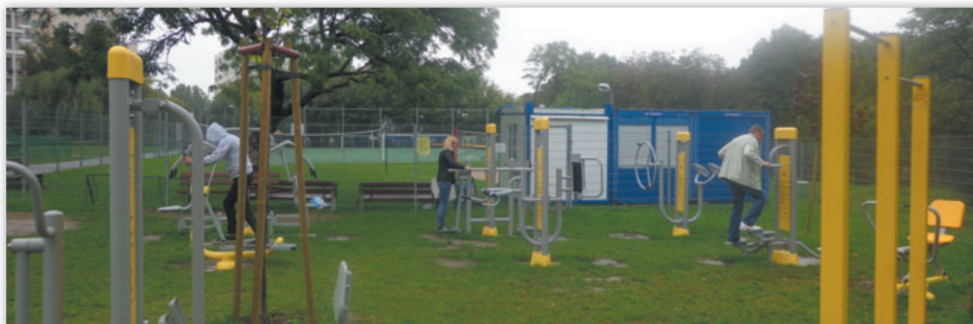
Siłownia plenerowa wybudowana przez Spółdzielnię w 2013 roku cieszy się dużym zainteresowaniem Mieszkańców.

im zwyczajem zafundował wszystkim do końca.... Grześki – wafelki w czekoladzie. uczestnikom turnieju, którzy wytrwali