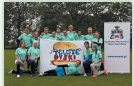
Cala drużyna z banerem

Do najważniejszych osiągnięć uzyskanych w minionym sezonie przez drużynę Tłuste Dyski zaliczyć należy udział