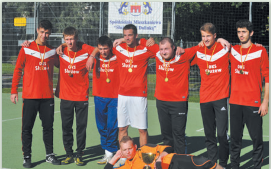
Zwycięzca turnieju OKS Służew 1