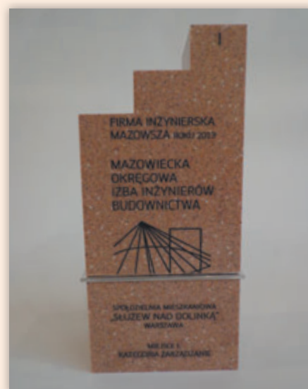
Jedna z nagród