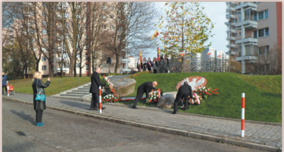
Składanie wieńców podczas uroczystości

Uroczystość zakończyła się wspaniałym koncertem, recytowaniem wierszy i śpiewaniem pieśni patriotycznych wykonanym przez dzieci ze Szkoły Podstawowej nr. 46 oraz solistów z Filharmonii Narodowej im. Romualda Traugutta.