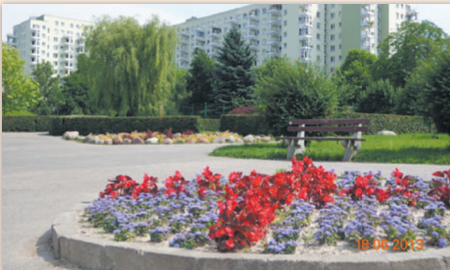
Klomb przy ulicy Batuty w pełnej krasie