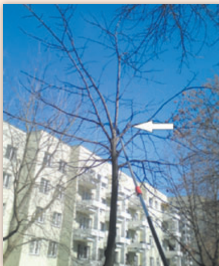
Usuwanie gałęzi rosnącej pod zbyt ostrym kątem

Drzewa obumarłe całkowicie lub w znacznym procencie są usuwane. Zgodnie z obowiązującą ustawą o ochronie środowiska art. 83 ust. 1 Ustawy z 16 kwietnia 2004r. o ochronie przyrody (DzU z 2009r. nr 151, poz. 1220, z późn. zm. usunięcie drzewa lub krzewu starszego niż dziesięcioletnie wymaga zgody w formie decyzji administracyjnej. Przepisy nakładają ograniczenia również w przypadku usuwania i przycinania konarów. Zgodnie z art. 82 ust. 1a ww. ustawy zabiegi w obrębie drzewa na terenach zieleni lub zadrzewieniach mogą obejmować wyłącznie: usuwanie gałęzi obumarłych, nadłamanych