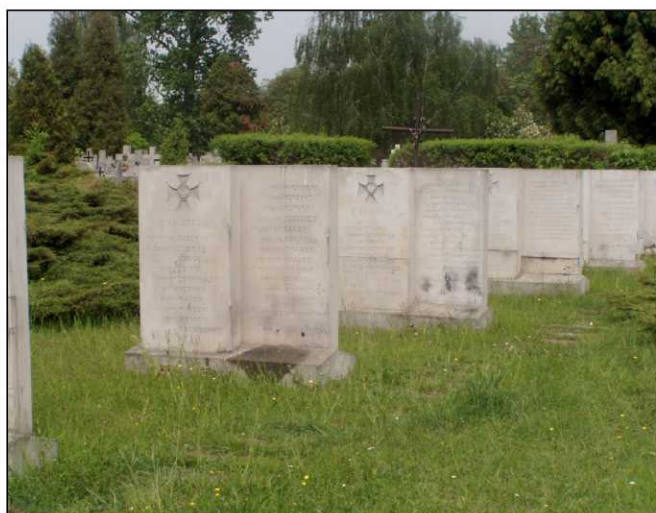
■ Groby ofiar II wojny światowej