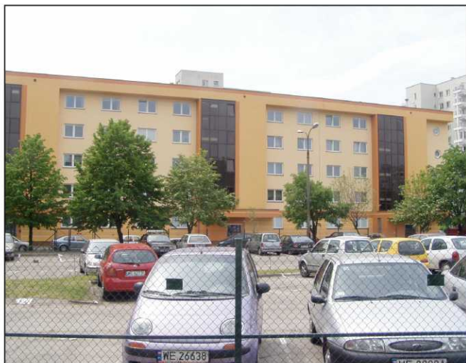
■ Na pierwszym planie parking przycmentarny, pod którym być może znajdują się mogiły pomordowanych

Pamięci ofiar reżimu komunistycznego, bezprawnie skazanych i zamordowanych potajemnie pochowanych na tym cmentarzu i w jego okolicy, na przełomie lat czterdziestych i pięćdziesiątych.