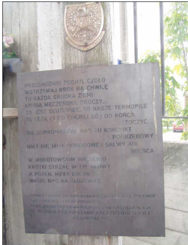
■ Tekst umieszczony na cmentarnym krzyżu upamiętniającym ofiary terroru stalinowskiego.