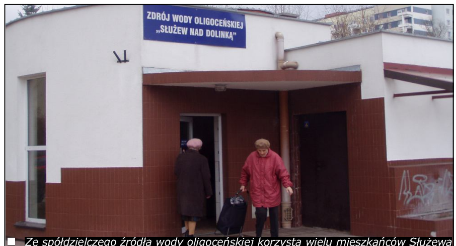
Ze spółdzielczego źródła wody oligoceńskiej korzysta wielu mieszkańców Służewa

W związku z licznymi pytaniami Członków i Mieszkańców Spółdzielni dotyczącymi wykupu gruntów, będących obecnie w wieczystym użytkowaniu Spółdzielni oraz przekształceniem praw do lokali w prawo odrębnej własności, Zarząd Spółdzielni uprzejmie informuje, że przedmiotowa problematyka szczegółowo omówiona zostanie w następnym wydaniu magazynu.