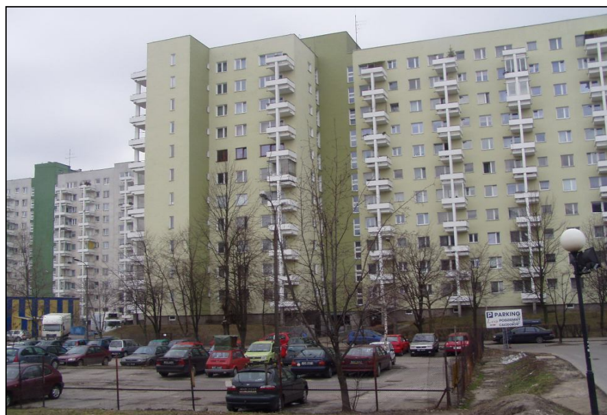
■ Wśród 42 budynków spółdzielni, znajdują się kolosy, które zamieszkuje więcej niż kilkuset mieszkańców

Spółdzielnia przygotowała kontrwyceony opracowane przez biegłego rzeczoznawcę, które szacują znacznie niższą wartość nieruchomości osiedla. Spółdzielnia będzie dążyć do zawarcia umowy z Urzędem m. st. Warszawy przed SKO, obniżając wartość opłaty rocznej. W przypadku nie zawarcia umowy będą dalsze postępowania przed sądami.